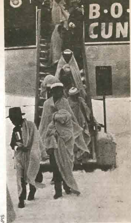
Porteurs d'un passeport britannique, ils viennent chercher un asile dans la métropole du Commonwealth.

Cependant, l'œuvre des Travaillistes, dans le domaine du racisme, a été, par certains aspects, positive. Une loi votée en 1965 ( Race Relations Act ) permet des recours contre toute discrimination dans un lieu public, les transports, les logements et l'emploi et sanctionne toute incitation à la haine raciale. Le Bureau des Relations raciales ( Race Relations Board ) est saisi des plaintes et entame une procédure de conciliation, sans avoir le pouvoir de porter plainte. Mais la loi est impuissante dans certains cas : le refus d'embauche n'est pas sanctionné, non plus que le refus de logement dans certaines catégories d'hôtels — les moins chers — ou chez l'habitant, de même que la spéculation immobilière des agences qui misent sur la fuite des habitants blancs de cer-