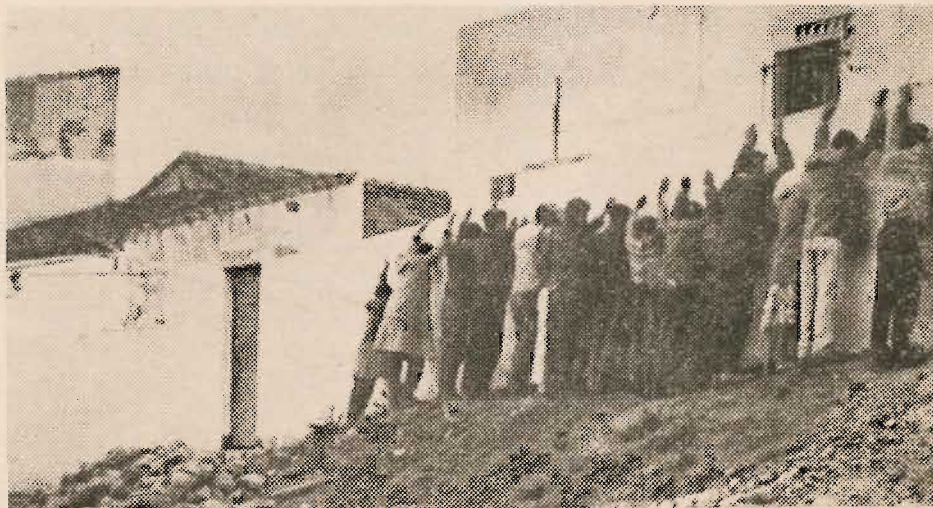
Scène de la vie algérienne