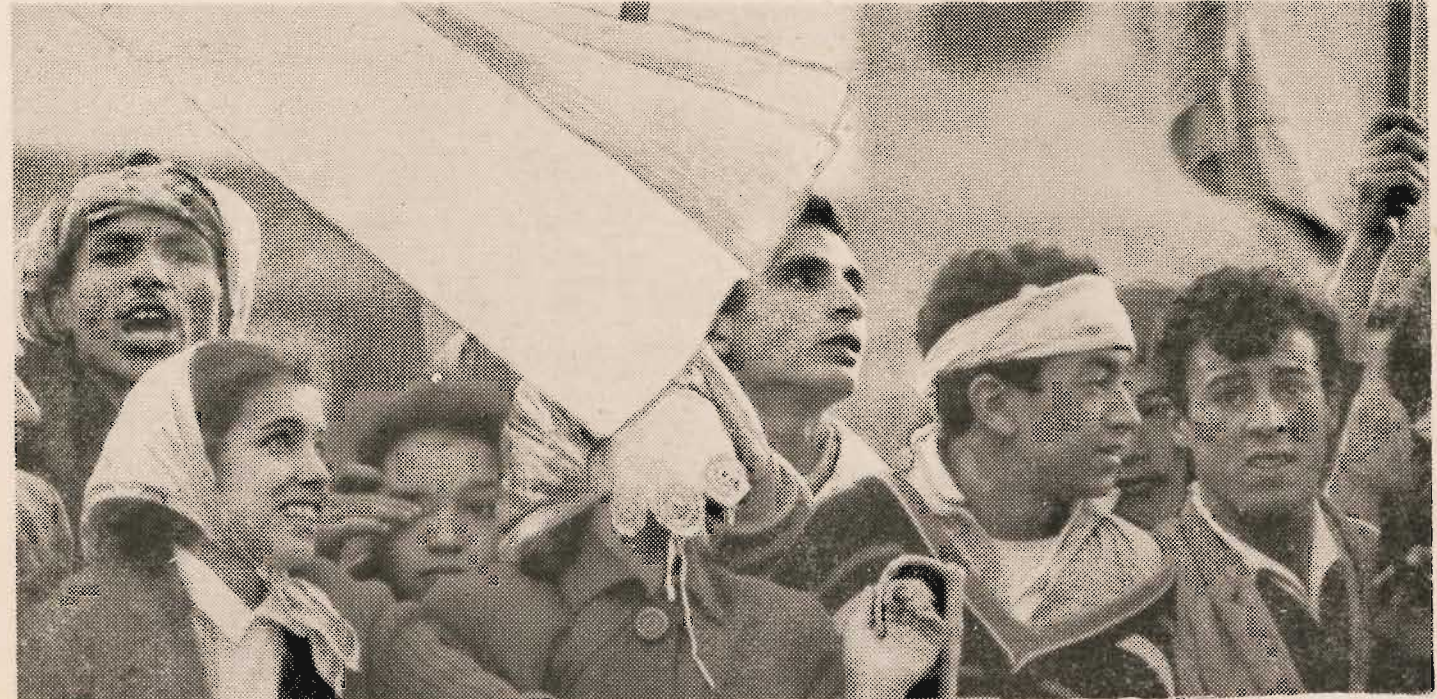
Dans les rues d'Alger, drapeaux en tête

« Dans la République algérienne que nous édifierons ensemble, il y aura de la place pour tous, du travail pour tous. L'Algérie nouvelle ne connaîtra ni barrières raciales ni haines religieuses. Elle respectera toutes les valeurs, tous les intérêts légitimes. »