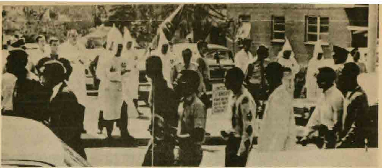
Deux « sociétés s'affrontent en permanence.