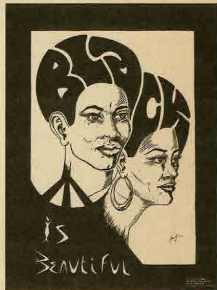
« Le noir est superbe »