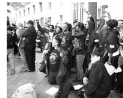
Les militants pro-Mumia, pendant les prises de parole le 24 avril 2012 à Washington

Lundi 23 avril, dès 9 heures, nous arrivons sur le parking de la prison. Cette prison de « moyenne sécurité » selon le descriptif de l'administration pénitentiaire héberge 2.300 prisonniers. Surprise, la configuration du site et l'architecture des bâtiments ressemblent, à s'y méprendre, à la prison de SCI Greene à Waynesburg, là où Mumia a passé presque trois décennies de sa vie et où nous lui avons rendu visite à de nombreuses reprises. Peu de véhicules en dehors des espaces réservés aux gardiens. Nous sommes parmi les premiers visiteurs. Les sept membres de la délégation française pénètrent dans le hall d'accueil de la prison.