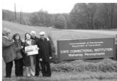
Photo au départ du centre pénitentiaire de Frackville (Mahanoy) après la visite à Mumia

Nous empruntons la très longue Pennsylvania Avenue ( l'une des artères qui délimite le « Triangle Fédéral » où se trouvent les grandes Institutions des États-Unis), longeons l'immense bloc de bâtiments du FBI ( autre symbole de lutte contre les pratiques racistes existant au sein de la police). Puis, alors que la manifestation semblait avoir atteint son point ultime vers l'Ellipse des jardins de la Maison Blanche, elle poursuit son chemin (les voitures de police remontent alors rapidement en tête de cortège et accompagnent le flot de manifestants) pour contourner l'arrière de la Maison Blanche et parvenir devant sa façade principale qui donne sur la rue et le square Lafayette.