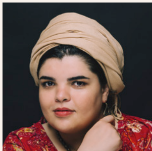
Soukaina Habiballah © Hind Alilich